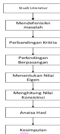
Gambar 1. Metodologi Penelitian

Metodologi yang diterapkan dalam melakukan penelitian ditunjukkan pada Gambar 1.