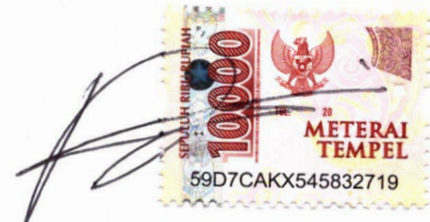
Dodi Dede Widodo