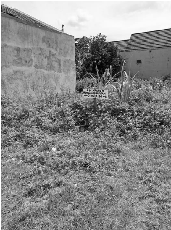
Gambar 4. Ajakan Tertib Dalam Mengelola Sampah