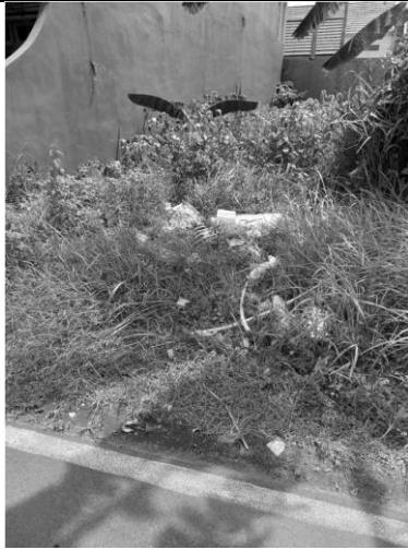
Gambar 1. Membuang Sampah Sembarangan Di Lahan Kosong Sekitar Pemukiman