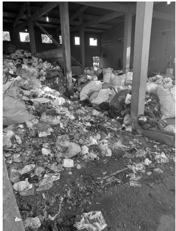
Gambar 5. Timbulan Sampah Over Load Di TPS

Pengelolaan sampah di tingkat rumah tangga yang dikelola melalui konsep open dumping , incenerator atau dibakar secara konvensional, sanitary landfill , belum menjadi solusi yang baik. Praktek pengelolaan sampah yang baik adalah yang mampu meminimalkan penumpukan timbulan sampah di tempat penampungan dan zero waste . Konsep zero waste merupakan praktek pengelolaan sampah yang baik dengan pendekatan teknologi pengolahan