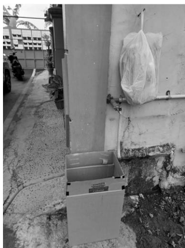
Gambar 7. Pengkondisian sampah tingkat Rumah Tangga siap diambil penggrobag