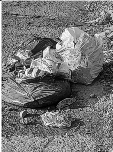
Gambar 2. Membuang Sampah Di Pinggir Jalan Desa Penghubung Ke Jalan Kabupaten