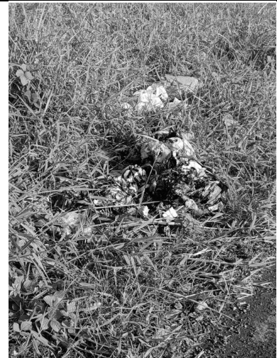
Gambar 3. Sampah Di Pinggir Jalan Dibakar