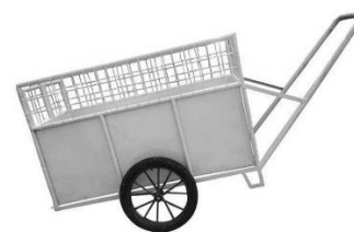
Gambar 8. Grobag siap mengumpulkan dan mengangkut sampah Ke TPS