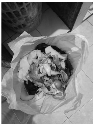
Gambar 6. Pengelolaan sampah tingkat Rumah Tangga di dapur

sampah recycle (mendaur ulang sampah), agar dapat dimanfaatkan kembali dan meminimalkan terjadinya kontaminasi di udara, air maupun tanah.