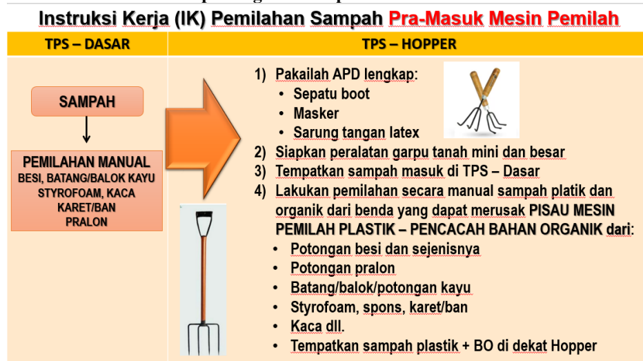
Gambar 2. Instruksi kerja PPS Singopuran – Kartasura pada kegiatan pemilahan seresh sampah organik dan plastik berbasis mesin otomatis.