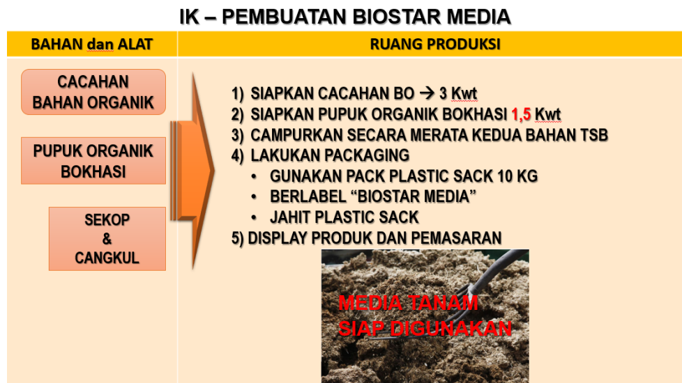
Gambar 4. Instruksi kerja PPS Singopuran – Kartasura pada kegiatan pembuatan bio-star media.