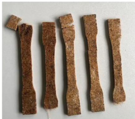
Gambar 2. Spesimen Hasil Uji Tarik

Gambar 2 di bawah menunjukkan spesimen komposit sabut kelapa yang telah melalui proses uji tarik. Berdasarkan pengujian tersebut, terlihat bahwa kegagalan pada spesimen terjadi pada bagian pegangan spesimen (grip). Hal ini dapat disebabkan oleh beberapa hal diantaranya gaya jepit (kompresi) dari mesin uji tarik yang menjepit ujung-ujung spesimen yang menyebabkan luas penampang pada daerah tersebut menjadi lebih kecil daripada bagian tengah spesime.