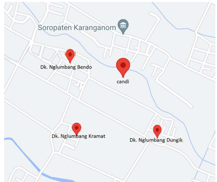
Gambar 2. Peta Konstelasi Candi dan Dukuh

Situs Candi Nglumbang Dungik berada di Dukuh Nglumbang Dungik, yang berbatasan dengan Dukuh Nglumbang Bendho di sebelah barat, dan Dukuh Nglumbang Kramat di barat daya.