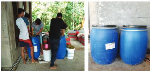
Gambar 3. Semua bahan dicampur dan difermentasi