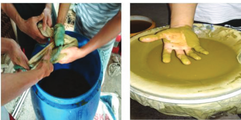
Gambar 4. Pesnab disaring kasar dan halus