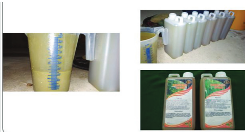
Gambar 5. Pengemasan dan pelabelan