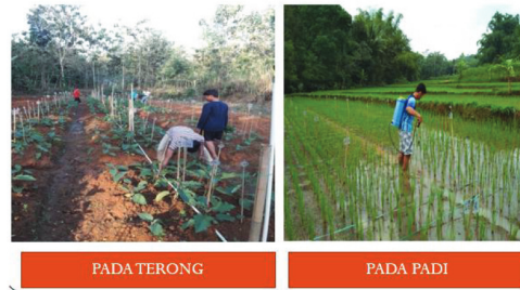
Gambar 6. Aplikasi pada tanaman terong dan padi

Penyampaian materi dilakukan kepada petani satu hari sebelum melakukan praktik pembuatan pestisida nabati, setelah materi di sampaikan kemudian pada hari berikutnya pelaksanaan pembuatan pestisida nabati yang diikuti oleh 25 petani anggota Mitra Padas Tani Mulyo dan dan 25 petani anggota Mitra Kismo 05, serta dihadiri oleh perwakilan dari perengkat dusun masing-masing.