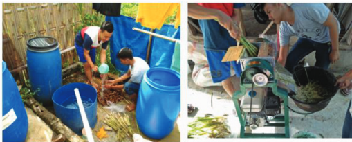
Gambar 2. Proses penggilingan bahan pesnab