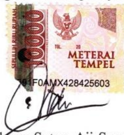
Aldama Setyo Aji Saputra D0421023